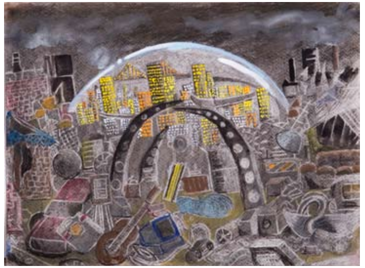
▲ 兒童組三等獎 不要用垃圾堆砌我們未來的家園 匡牧青 Quincy Kuang