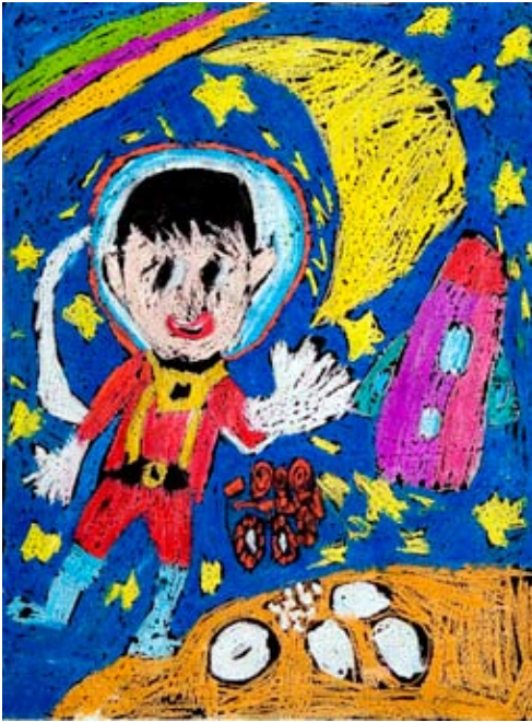
◀ 幼兒組一等獎 Future 袁梓芮 Sean Yan