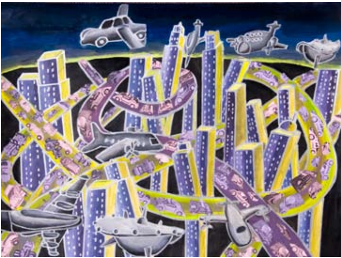
▲ 兒童組三等獎 Future 解瑩 Sherry Xie